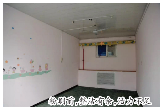
粉刷前，整洁有余，活力不足

活动，通过发挥北新建材“龙牌”漆高品质的产品优势与清华大学建筑、美术、土木专业学生的创造力和设计能力，为一些比较贫困或特殊的学校开展空间改善爱心活动，从外观、内饰、安全等角度切实提升孩子们的居住环境，为他们营造一个健康美丽的生活环境。自2012年至今，北新建材已先后在顺义红青蓝小学、北京太阳村、重庆太原乡、怀柔育才学校、河北省灵寿县中倾井小学等地多次开展此类主题活动，获得老师和同学们的一致喜爱以及社会各界的一致好评。