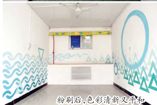
粉刷后，色彩清新又平和