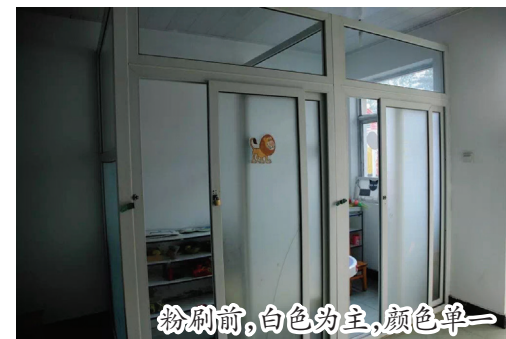
粉刷前，白色为主，颜色单一