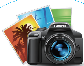
文 / 图 行政人事部