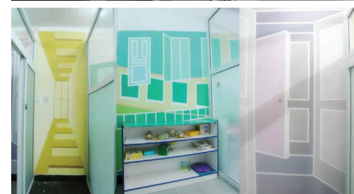
粉刷后，糖果色系，富有想象力