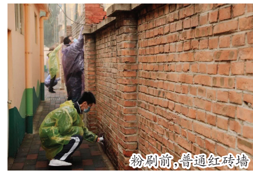
粉刷前，普通红砖墙